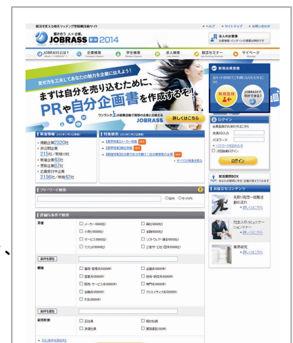
【JOBASS 新卒 2014 トップページ】

サイト上に公開された「就活プロフィール」から、その学生の考え方や能力に興味を持った企業は、直接「選考オファー※3」を送ることができます。