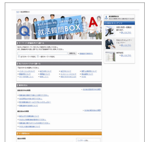
【質問BOXイメージ画像】