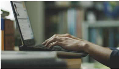
(1)「JOBASS 新卒 2014」に登録する「山本タケル」君。