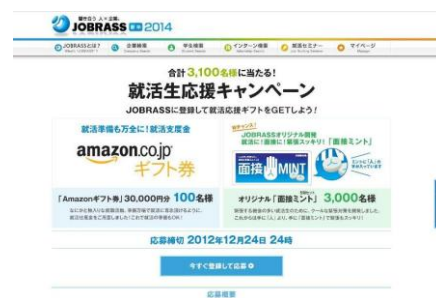
「就活生応援キャンペーン」TOP ページ

※1 選考オファー:企業がぜひ会いたいと感じた学生に対し、特別選考のメッセージを送ることができます。