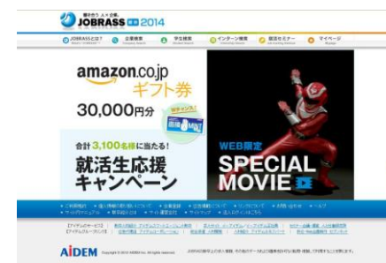
テレビCM連動ムービー「山本タケルのオファーの秘密『HERO』」