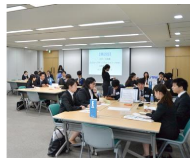
【逆求人イベントの様子】

サイト上だけではなく、実際に学生と話することができる逆求人イベントを定期開催します。マッチングを高めるため、参加企業は5社～、参加学生は30名前後に限定しています。最大の特長は、学生が企業に自身をアピールできる自己PRタイムやグループディスカッション等があることです。イベント経由での選考オファーは、通常の3倍以上の応諾率(2015年5月実績)を誇っています。