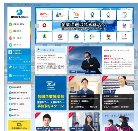
【JOBASS 新卒サイト イメージ画像】

アピール型就活サイト『JOBASS 新卒』は、「逆求人」と呼ばれるスタイルの就職活動サイトです。これは、学生が作成・登録する「就活プロフィール」をもとに、企業が学生に直接「選考オファー(スカウト)」を出し、学生がオファーに応じた際には選考に進んでいく、というものです。一般的な就活サイトは3年次から登録ができますが、リニューアルに伴い『JOBASS 新卒』では1年次から登録が可能になります。このことにより、学生は早期の段階よりキャリア形成を行うことができ、一方企業は、採用シーズン以外にもインターンシップ等で学生と接点を持つことができます。