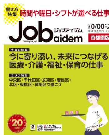
【現在の『ジョブアイDEM』】